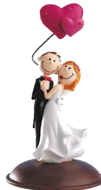
Nuvis Ref: 305188 13 cm