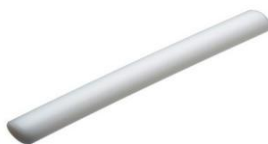
Corró d'amassar de polietilè 50x3,5