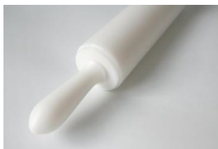
Corró d'amassar de polietilè 45x5