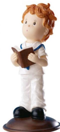
Nenes cominió Ref: 410004 Nen 12 cm Ref: 410005 Nena 12 cm