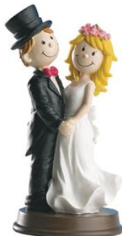
Nuvis Ref: 410810 13 cm