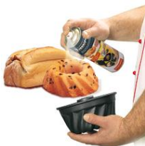
Spray desmoltlejant per safates i motlles