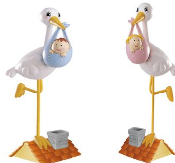
Cigonyes Ref: 410825 Blau 18 cm Ref: 410826 Rosa 18 cm